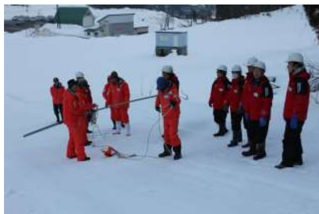
救助訓練実施状況（平成29年12月23日）