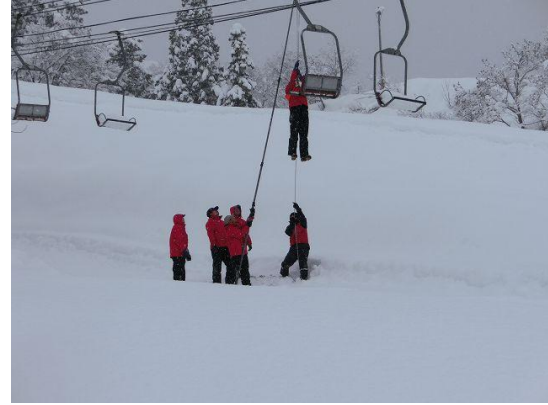
救助訓練実施状況（平成24年12月20日）