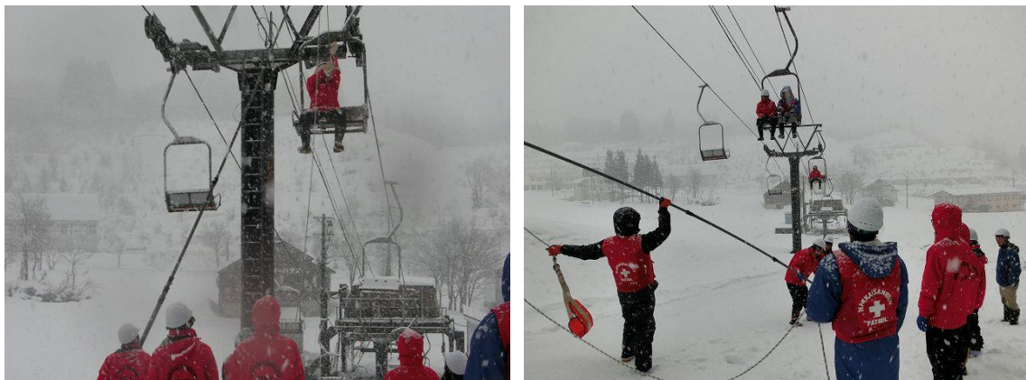
救助訓練実施状況（平成25年12月21日）