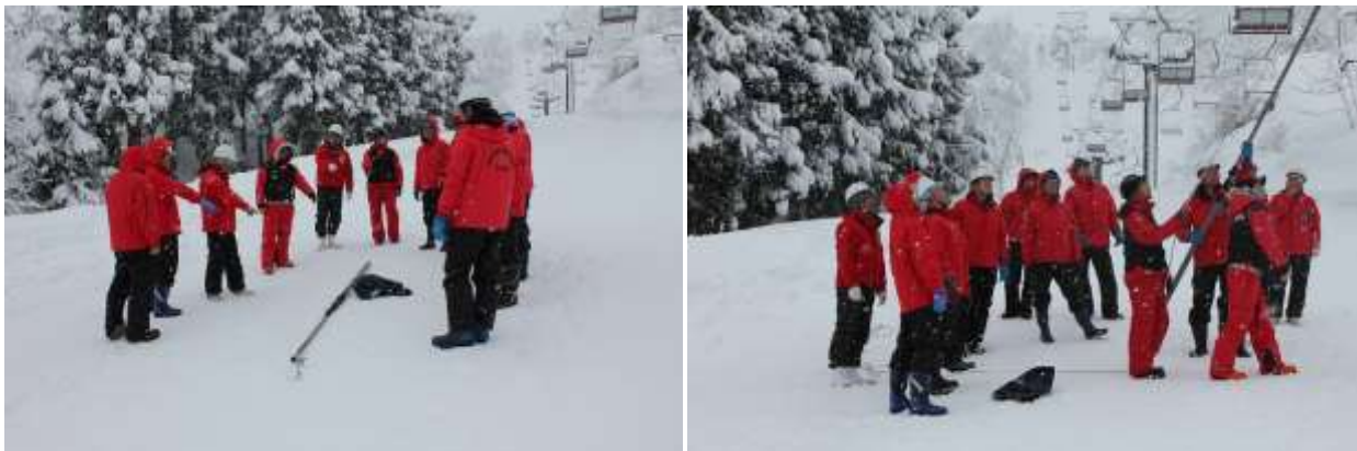
救助訓練実施状況（平成26年12月21日）