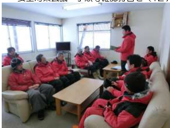
安全対策会議・手順等確認打合せ(12月21日/1月8日)