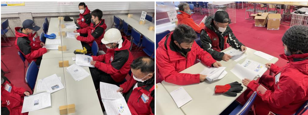
安全総点検会議（令和4年12月21日実施）