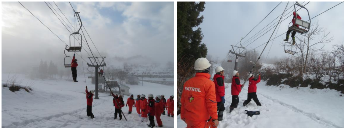
救助訓練実施状況（平成30年12月21日）