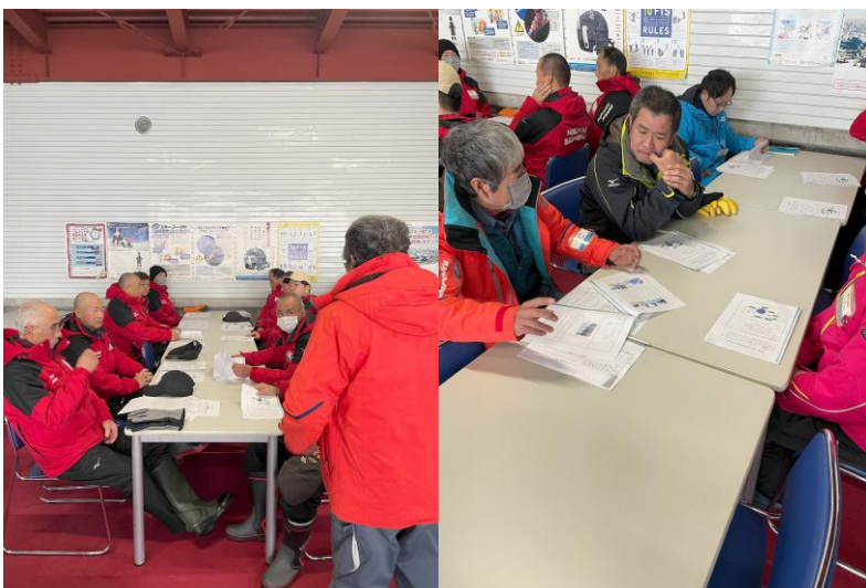
安全総点検会議（令和6年12月23日実施）