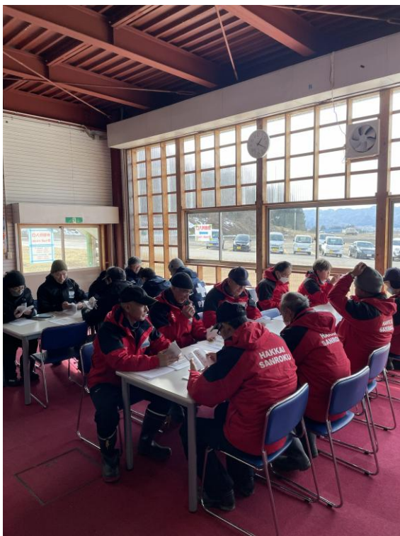
安全総点検会議（令和7年12月23日実施）